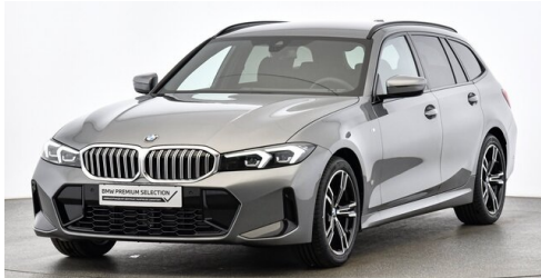
Autohaus Huber GmbH - Bruck/Mur- www.huberbruck.com