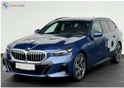
Mitglieds der GADY Family