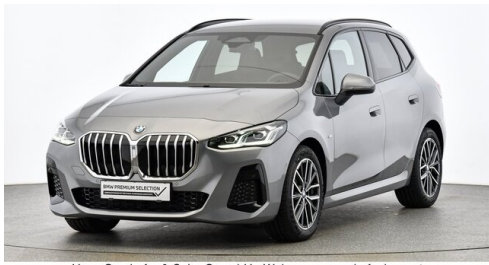
Hans Geyrhofer & Sohn GesmbH - Wels - www.geyrhofer.bmw.at