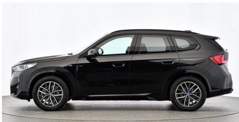
Neuper GmbH - Judenburg - www.neuper.at