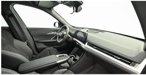
Neuper GmbH - Judenburg - www.neuper.at