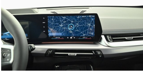
Neuper GmbH - Judenburg - www.neuper.at