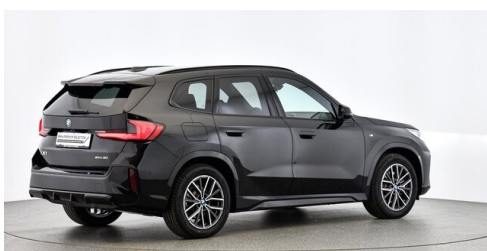
Neuper GmbH - Judenburg - www.neuper.at