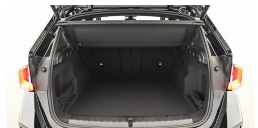
Neuper GmbH - Judenburg - www.neuper.at