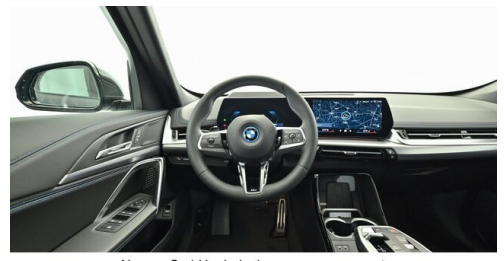
Neuper GmbH - Judenburg - www.neuper.at