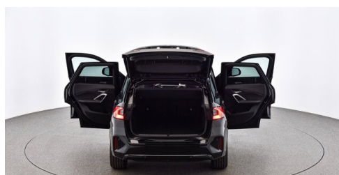
Neuper GmbH - Judenburg - www.neuper.at