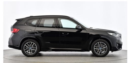
Neuper GmbH - Judenburg - www.neuper.at