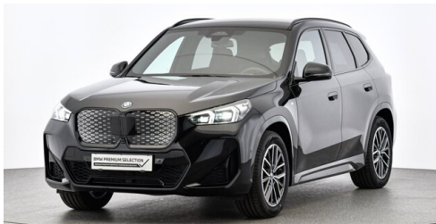
Neuper GmbH - Judenburg - www.neuper.at