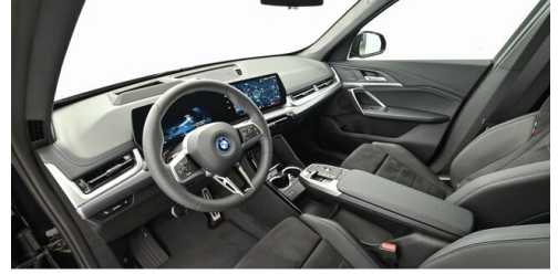
Neuper GmbH - Judenburg - www.neuper.at