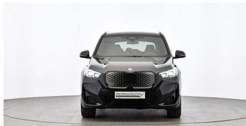
Neuper GmbH - Judenburg - www.neuper.at