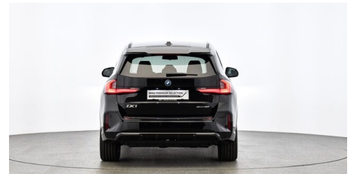
Neuper GmbH - Judenburg - www.neuper.at