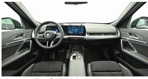
Neuper GmbH - Judenburg - www.neuper.at