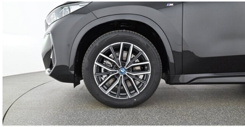
Neuper GmbH - Judenburg - www.neuper.at