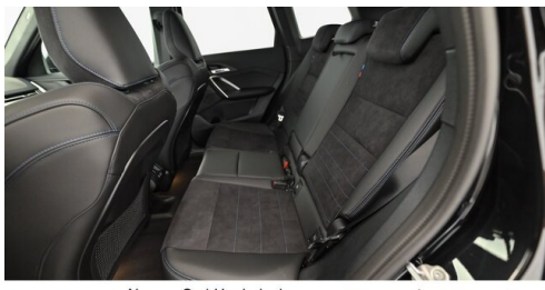
Neuper GmbH - Judenburg - www.neuper.at