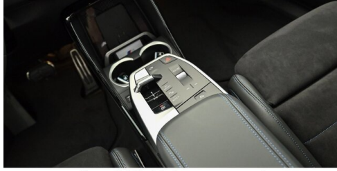
Neuper GmbH - Judenburg - www.neuper.at