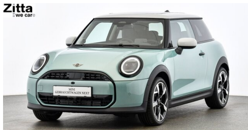
Zitta Betriebs GmbH - Perchtoldsdorf - www.zitta.at