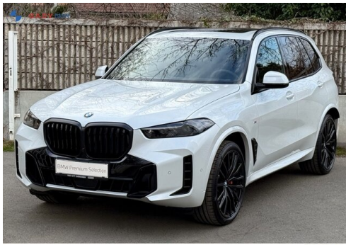
Mitglied der GADV Family