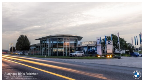
Autohaus BMW Reichhart Weg 2, 2026 6, 4319 Mauthausen +43 72 25 2588 | www.bmw-reichhart.at