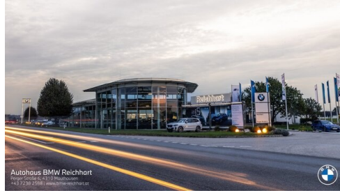
Autohaus BMW Reichhart Weg 2, 2026 6, 4319 Mauthausen +43 72 20 2588 | www.bmw-reichhart.at