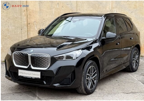
Miembros de GADY Family