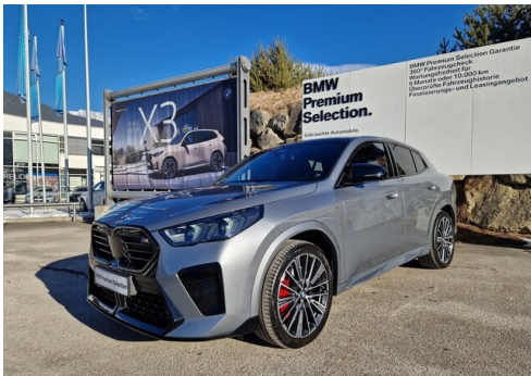
Zorn-Wolf GmbH - Imst - www.zorn-wolf.bmw.at 05412 / 63518