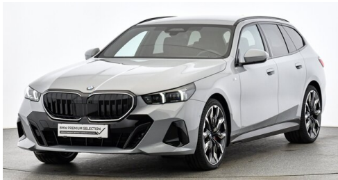
Hans Geyrhofer & Sohn GesmbH - Wels - www.geyrhofer.bmw.at