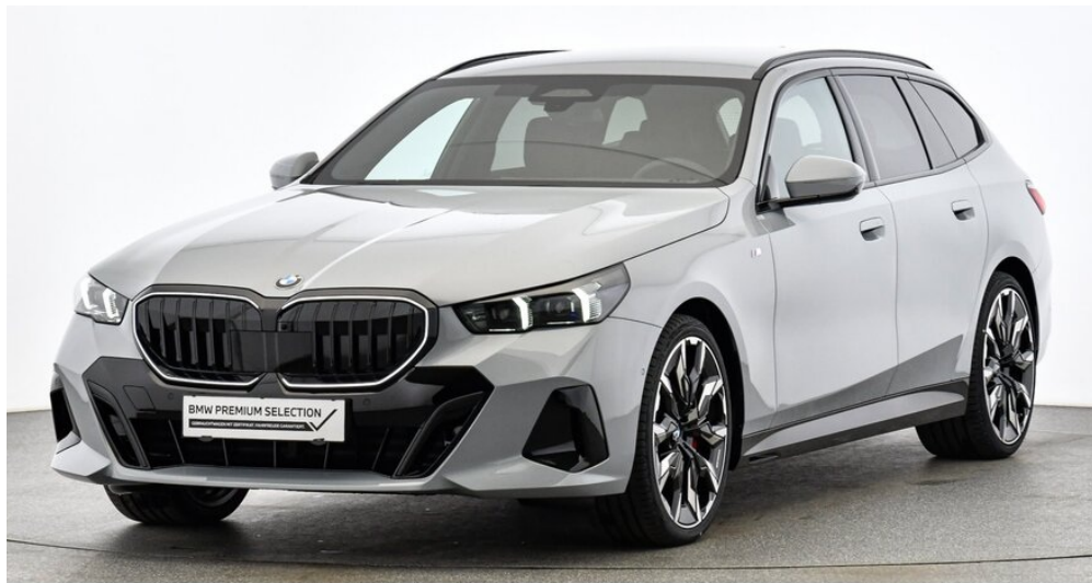
Hans Geyrhofer & Sohn GesmbH - Wels - www.geyrhofer.bmw.at