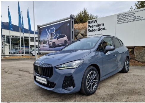
Zorn-Wolf GmbH - Imst - www.zorn-wolf.bmw.at 05412 / 63518