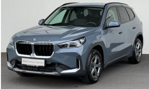
Mitglieds der GADY Family