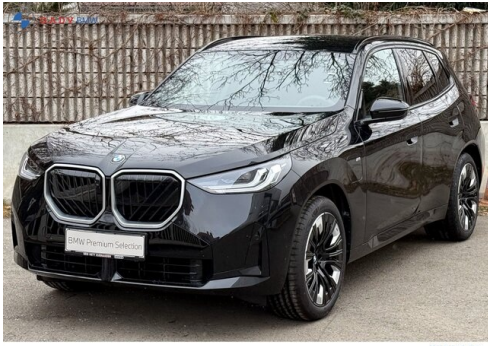
Mitglied der GADV Family