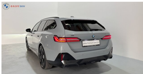
Mitglied der GADY Family