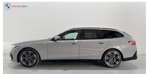
Mitglied der GADY Family