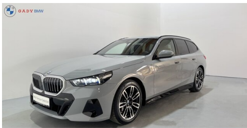
Mitglied der GADY Family