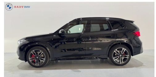
Mitglied der GADY Family