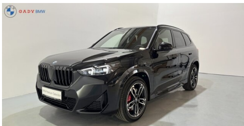
Mitglied der GADY Family