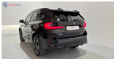
Mitglied der GADY Family