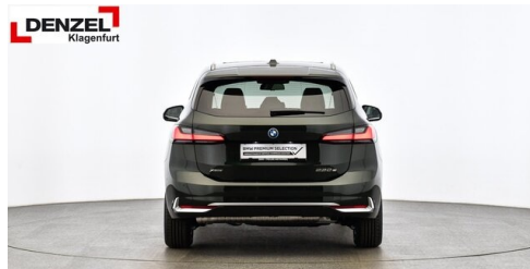
Wolfgang Denzel Auto AG - Kundencenter Klagenfurt - www.denzel.at