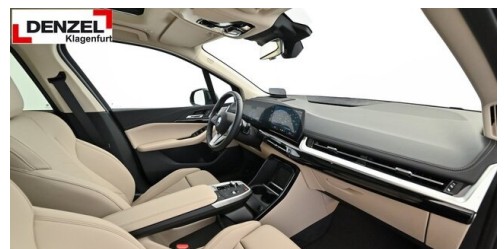
Wolfgang Denzel Auto AG - Kundencenter Klagenfurt - www.denzel.at