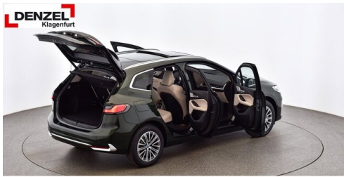
Wolfgang Denzel Auto AG - Kundencenter Klagenfurt - www.denzel.at