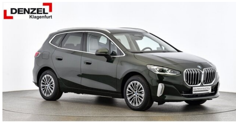
Wolfgang Denzel Auto AG - Kundencenter Klagenfurt - www.denzel.at