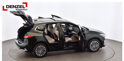
Wolfgang Denzel Auto AG - Kundencenter Klagenfurt - www.denzel.at