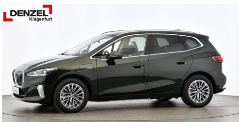
Wolfgang Denzel Auto AG - Kundencenter Klagenfurt - www.denzel.at