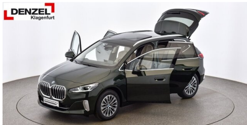
Wolfgang Denzel Auto AG - Kundencenter Klagenfurt - www.denzel.at