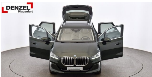
Wolfgang Denzel Auto AG - Kundencenter Klagenfurt - www.denzel.at