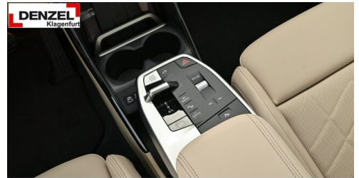
Wolfgang Denzel Auto AG - Kundencenter Klagenfurt - www.denzel.at