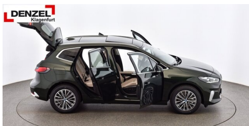
Wolfgang Denzel Auto AG - Kundencenter Klagenfurt - www.denzel.at