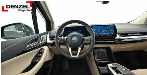
Wolfgang Denzel Auto AG - Kundencenter Klagenfurt - www.denzel.at