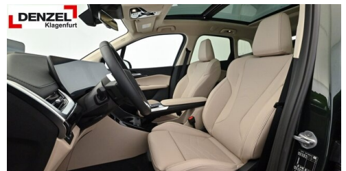
Wolfgang Denzel Auto AG - Kundencenter Klagenfurt - www.denzel.at