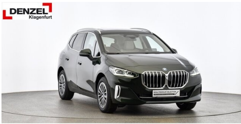
Wolfgang Denzel Auto AG - Kundencenter Klagenfurt - www.denzel.at