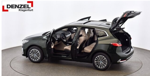
Wolfgang Denzel Auto AG - Kundencenter Klagenfurt - www.denzel.at