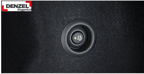
Wolfgang Denzel Auto AG - Kundencenter Klagenfurt - www.denzel.at