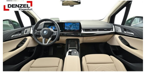
Wolfgang Denzel Auto AG - Kundencenter Klagenfurt - www.denzel.at