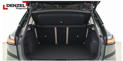
Wolfgang Denzel Auto AG - Kundencenter Klagenfurt - www.denzel.at