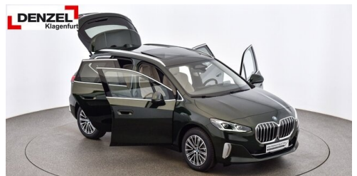
Wolfgang Denzel Auto AG - Kundencenter Klagenfurt - www.denzel.at