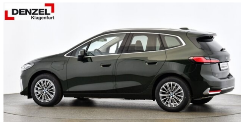
Wolfgang Denzel Auto AG - Kundencenter Klagenfurt - www.denzel.at