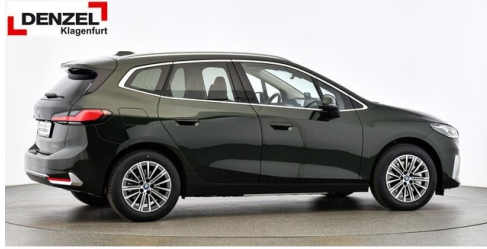
Wolfgang Denzel Auto AG - Kundencenter Klagenfurt - www.denzel.at