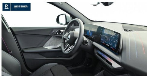
Autohaus Reiterer GmbH - Deutschlandsberg - www.reiterer.bmw.at