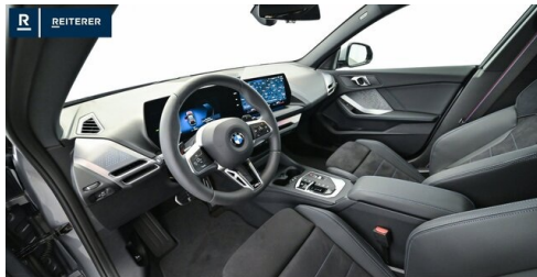
Autohaus Reiterer GmbH - Deutschlandsberg - www.reiterer.bmw.at