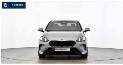
Autohaus Reiterer GmbH - Deutschlandsberg - www.reiterer.bmw.at