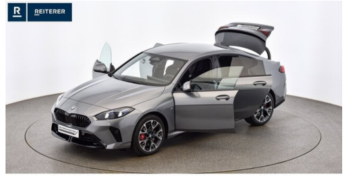
Autohaus Reiterer GmbH - Deutschlandsberg - www.reiterer.bmw.at