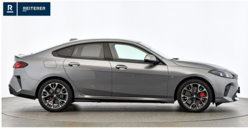
Autohaus Reiterer GmbH - Deutschlandsberg - www.reiterer.bmw.at