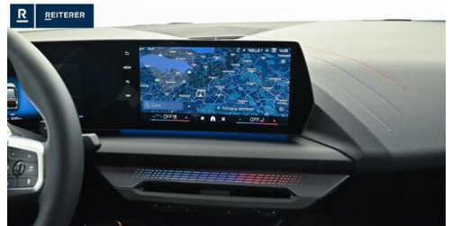
Autohaus Reiterer GmbH - Deutschlandsberg - www.reiterer.bmw.at