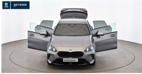
Autohaus Reiterer GmbH - Deutschlandsberg - www.reiterer.bmw.at