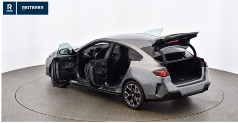
Autohaus Reiterer GmbH - Deutschlandsberg - www.reiterer.bmw.at