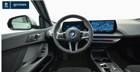
Autohaus Reiterer GmbH - Deutschlandsberg - www.reiterer.bmw.at