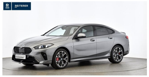
Autohaus Reiterer GmbH - Deutschlandsberg - www.reiterer.bmw.at