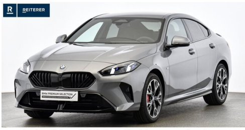
Autohaus Reiterer GmbH - Deutschlandsberg - www.reiterer.bmw.at