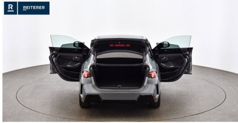
Autohaus Reiterer GmbH - Deutschlandsberg - www.reiterer.bmw.at