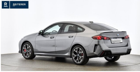
Autohaus Reiterer GmbH - Deutschlandsberg - www.reiterer.bmw.at