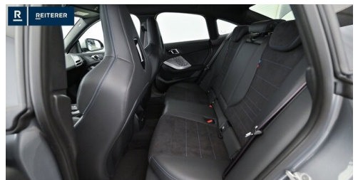
Autohaus Reiterer GmbH - Deutschlandsberg - www.reiterer.bmw.at