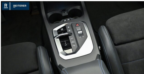
Autohaus Reiterer GmbH - Deutschlandsberg - www.reiterer.bmw.at