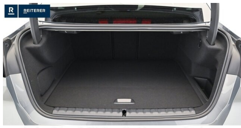
Autohaus Reiterer GmbH - Deutschlandsberg - www.reiterer.bmw.at