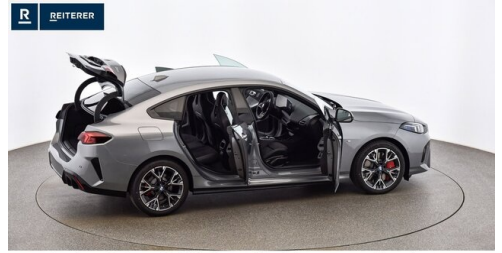
Autohaus Reiterer GmbH - Deutschlandsberg - www.reiterer.bmw.at