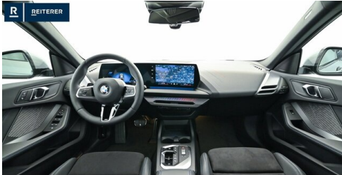
Autohaus Reiterer GmbH - Deutschlandsberg - www.reiterer.bmw.at