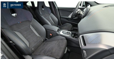
Autohaus Reiterer GmbH - Deutschlandsberg - www.reiterer.bmw.at