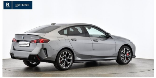
Autohaus Reiterer GmbH - Deutschlandsberg - www.reiterer.bmw.at