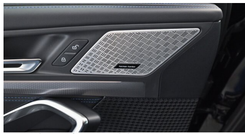
H. Slawitscheck GmbH - Amstetten-St. Georgen/Y. - www.slawitscheck.bmw.at