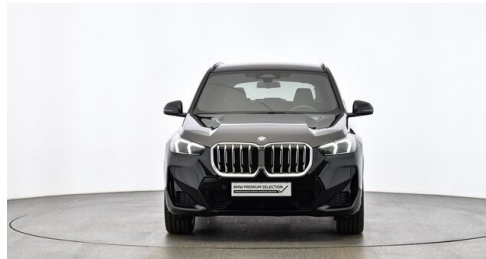
H. Slawitscheck GmbH - Amstetten-St. Georgen/Y. - www.slawitscheck.bmw.at