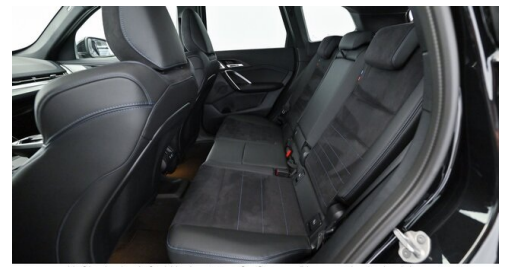
H. Slawitscheck GmbH - Amstetten-St. Georgen/Y. - www.slawitscheck.bmw.at