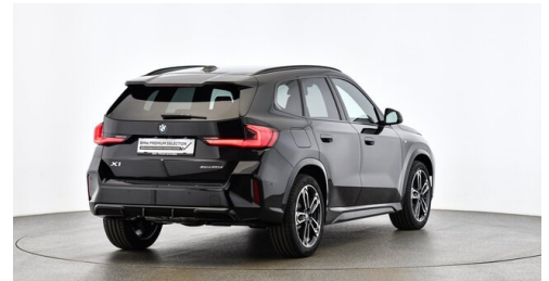
H. Slawitscheck GmbH - Amstetten-St. Georgen/Y. - www.slawitscheck.bmw.at