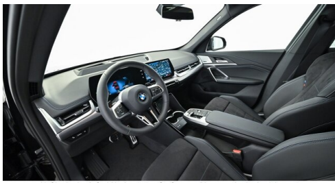
H. Slawitscheck GmbH - Amstetten-St. Georgen/Y. - www.slawitscheck.bmw.at