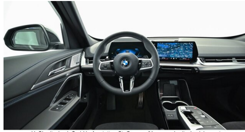
H. Slawitscheck GmbH - Amstetten-St. Georgen/Y. - www.slawitscheck.bmw.at