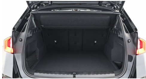
H. Slawitscheck GmbH - Amstetten-St. Georgen/Y. - www.slawitscheck.bmw.at