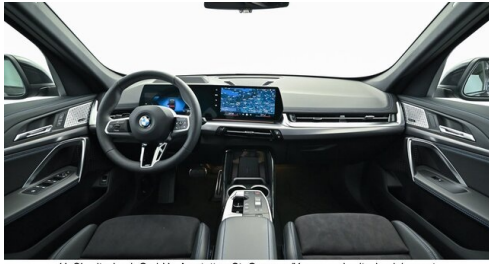
H. Slawitscheck GmbH - Amstetten-St. Georgen/Y. - www.slawitscheck.bmw.at