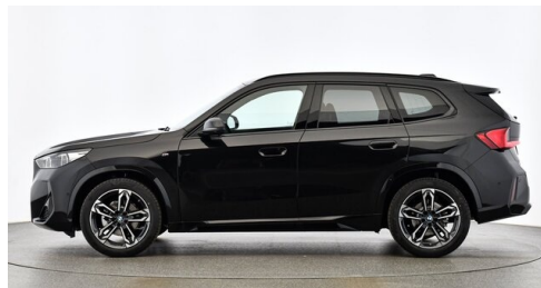
H. Slawitscheck GmbH - Amstetten-St. Georgen/Y. - www.slawitscheck.bmw.at