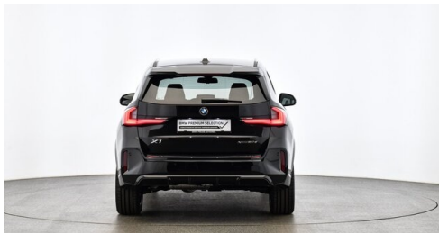
H. Slawitscheck GmbH - Amstetten-St. Georgen/Y. - www.slawitscheck.bmw.at