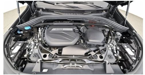
H. Slawitscheck GmbH - Amstetten-St. Georgen/Y. - www.slawitscheck.bmw.at