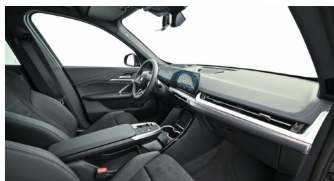
H. Slawitscheck GmbH - Amstetten-St. Georgen/Y. - www.slawitscheck.bmw.at