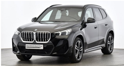
H. Slawitscheck GmbH - Amstetten-St. Georgen/Y. - www.slawitscheck.bmw.at