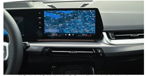
H. Slawitscheck GmbH - Amstetten-St. Georgen/Y. - www.slawitscheck.bmw.at