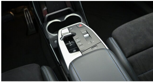
H. Slawitscheck GmbH - Amstetten-St. Georgen/Y. - www.slawitscheck.bmw.at