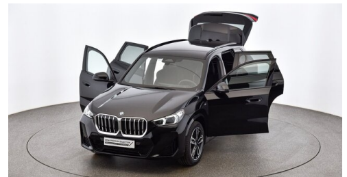
H. Slawitscheck GmbH - Amstetten-St. Georgen/Y. - www.slawitscheck.bmw.at