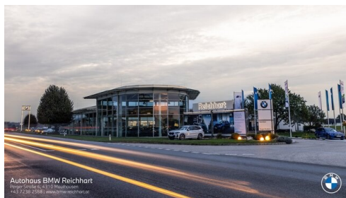
Autohaus BMW Reichhart Perger Straße 6, 1111 Mauthausen +43 2236 2588 | www.bmw-reichhart.at