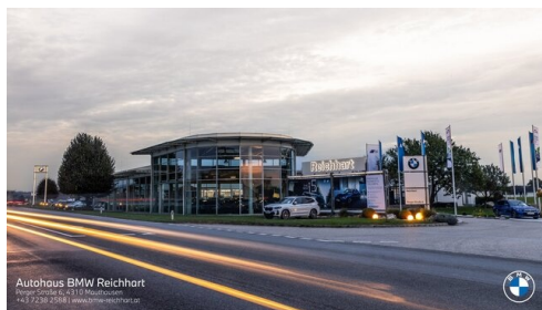
Autohaus BMW Reichhart Perger Straße 6, 1110 Mauthausen +43 2236 2588 | www.bmw-reichhart.at