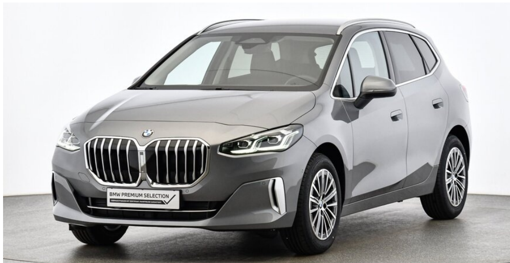
Höglinger Denzel GesmbH - Linz - www.bmw-hoeglinger.at