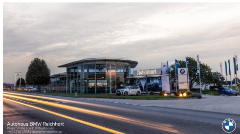
Autohaus BMW Reichhart Perger Straße 6, 1111 Mauthausen +43 2236 2588 | www.bmw-reichhart.at