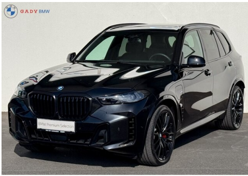
MiGros der GADY Family