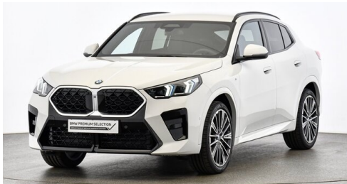
Hans Geyrhofer & Sohn GesmbH - Wels - www.geyrhofer.bmw.at