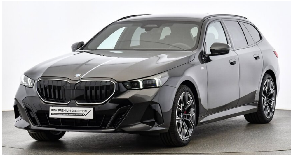
Hans Geyrhofer & Sohn GesmbH - Wels - www.geyrhofer.bmw.at