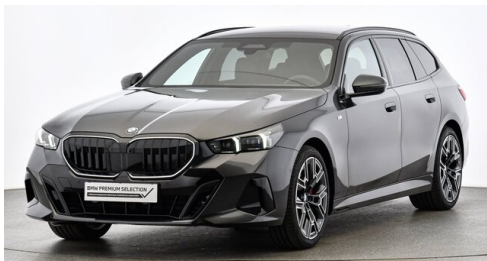
Hans Geyrhofer & Sohn GesmbH - Wels - www.geyrhofer.bmw.at