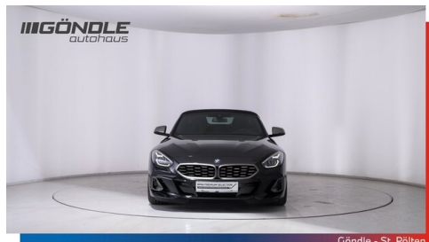
Göndle - St. Pölten