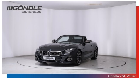
Göndle - St. Pölten