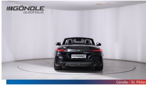
Göndle - St. Pölten