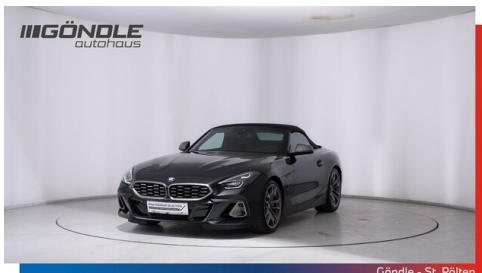
Göndle - St. Pölten