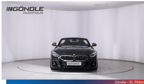
Göndle - St. Pölten