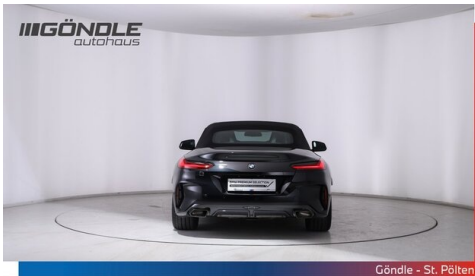
Göndle - St. Pölten