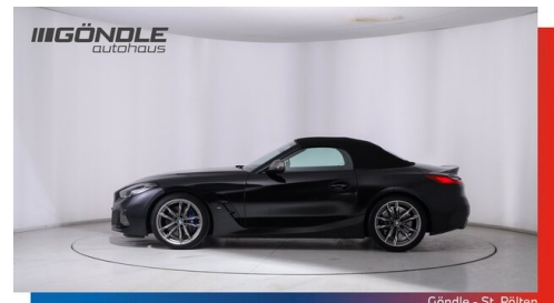
Göndle - St. Pölten