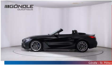
Göndle - St. Pölten