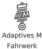
Adaptives M Fahrwerk