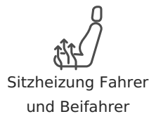
Sitzheizung Fahrer und Beifahrer