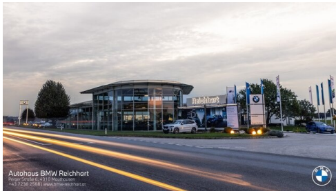
Autohaus BMW Reichhart Perger Straße 6, 3111 Mauthausen +43 72 38 2588 | www.bmw-reichhart.at