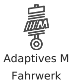
Adaptives M Fahrwerk