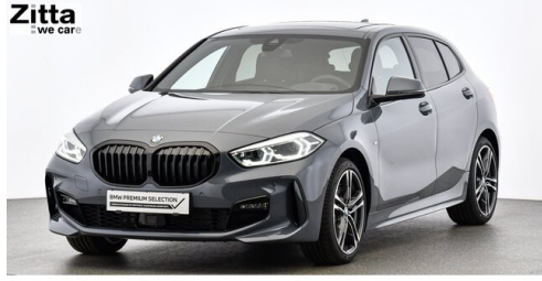
Zitta Betriebs GmbH - Wien - www.zitta.at