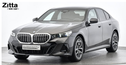
Zitta Betriebs GmbH - Wien - www.zitta.at