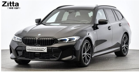
Zitta Betriebs GmbH - Wien - www.zitta.at