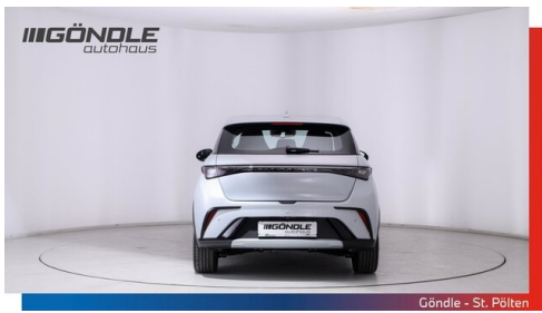
Göndle - St. Pölten