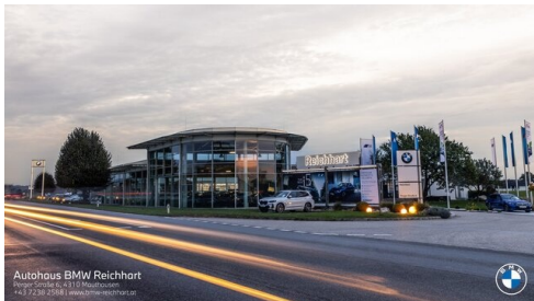
Autohaus BMW Reichhart Rieger-Gürtel 6, 3110 Mauthausen +43 29 25 20 80, www.bmw-reichhart.at