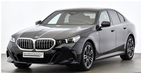
Höglinger Denzel GesmbH - Linz - www.bmw-hoeglinger.at