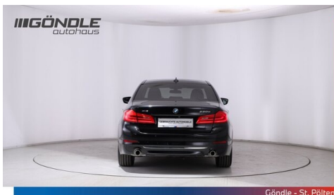
Göndle - St. Pölten