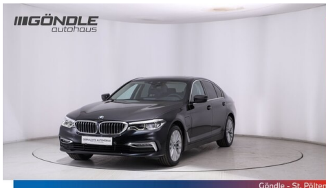
Göndle - St. Pölten