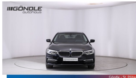
Göndle - St. Pölten