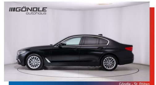
Göndle - St. Pölten