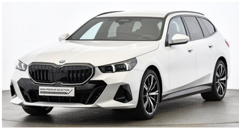
drive ME GmbH - Regau - www.driveme.bmw.at