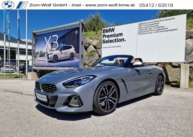
Fahrzeug wird im Kundenauftrag verkauft