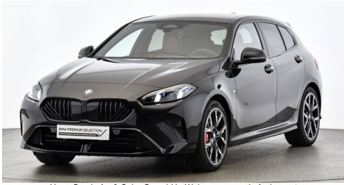
Hans Geyrhofer & Sohn GesmbH - Wels - www.geyrhofer.bmw.at