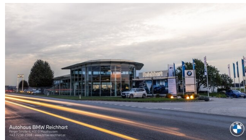
Autohaus BMW Reichhart Perger Straße 6, 4310 Mauthausen +43 7280 2588 | www.bmw-reichhart.at