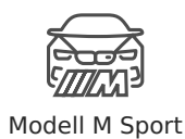
Modell M Sport